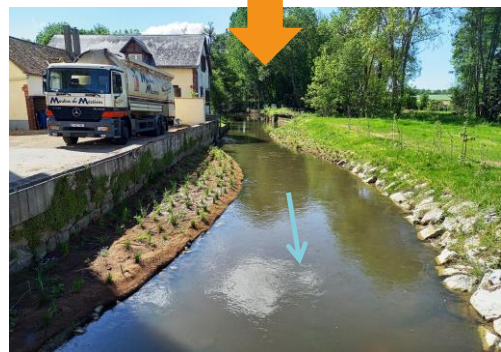
©SBV4R – mai 2023 – 5 mois après travaux, 1 mois après plantations